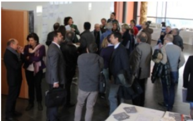
N valgugn intervagnus pro l'Open Space a La Ila ai 04 de merz 2016.